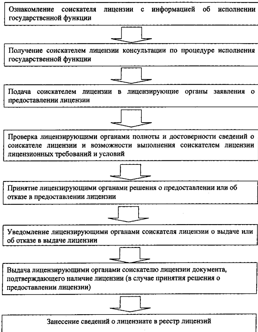
Схема последовательности действий при исполнении государственной функции по предоставлению лицензии