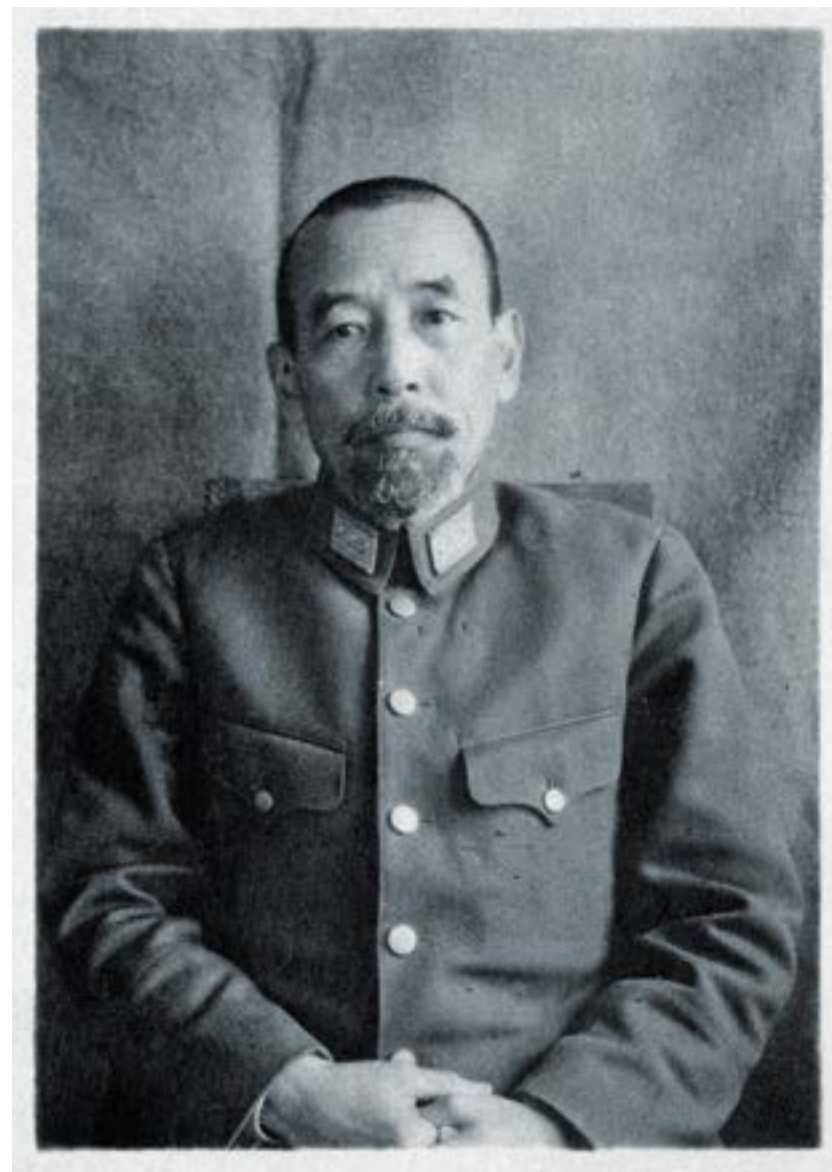
Подсудимый Ямада Отозоо, главнокомандующий Квантунской армией, генерал.